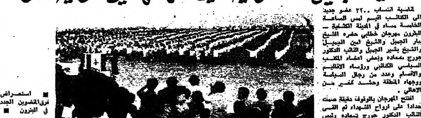
استمرص في المنصور

لغاية انتساب ٣٢٠ عضو جديد الى الكتائب اقيم امس في القاعة الخامسة مساء في الهيئة الثقافية - البيرون مهرجان خطابي حضره الشيخ بيار الجميل والشيخ أمين الجميل والشيخ يشير الجميل والقائم الدكتور جورج سماعة وعضو امضاء الكتائب السيسي الكتائبي ورؤساء الاقليات والاقسام وعدد من رجال السياسة الخطية وحشد هضغ من الاعالي . افتتح المهرجان بالوقوف دقيقة صمت خدادا على ارواح الشهداء ثم القى الكاتب الدكتور جورج سماعة رئيس القيم الدكتور أمين الجميل والشيخ بالطول التي حثها الشباب اللبناني تحرير الارض والشعب واما التي تركز الدولة المصرية القادرة على جميع الاصعدة السياسية والاجتماعية والاقتصادية والتي ابرز دور الكاتب التاريخي في منطقة البيرون . ثم تكلم الدكتور اسطوان ميسري رئيس مجلس الشرف دعما الى اجل العمل والتفاني الذي يقوم على الخطية وهذا العمل وحده كفيل بظلال لبنان .